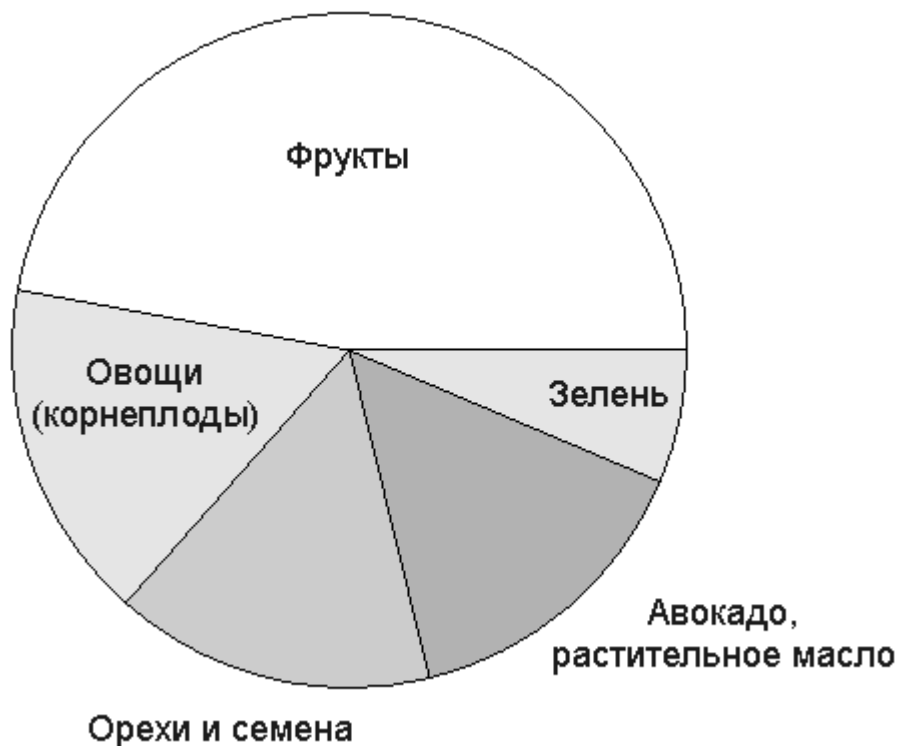
Рис. 3. Рацион сыроеда.

Что же ещё едят сыроеды? Ответ: почти все потребляют большое количество орехов и семян. Часто сыроеды, испытывая тоску по прошлым застольям, пытаются воспроизвести любимые блюда, используя только сырые компоненты. Тогда они используют орехи вместо продуктов, содержащих углеводы, хотя первые на 70-80% состоят из жиров. Кроме того, сыроеды потребляют слишком много растительных масел и авокадо, так как эти продукты обычно являются основой для салатных соусов.