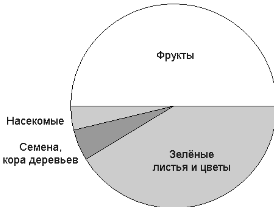
Рис. 1. Рацион шимпанзе.

Понимание основ питания шимпанзе поможет нам лучше понять потребности людей. Посмотрите на диаграмму (рис. 1), на которой показан типичный рацион шимпанзе в диких джунглях (я создала её, основываясь на данных из книги Джейн Гудолл «Шимпанзе из долины Гомбе»).